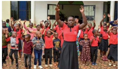
Partnerschaftsgottesdienst am 12.11.: Kinder-gottesdienstkinder in Kilakala