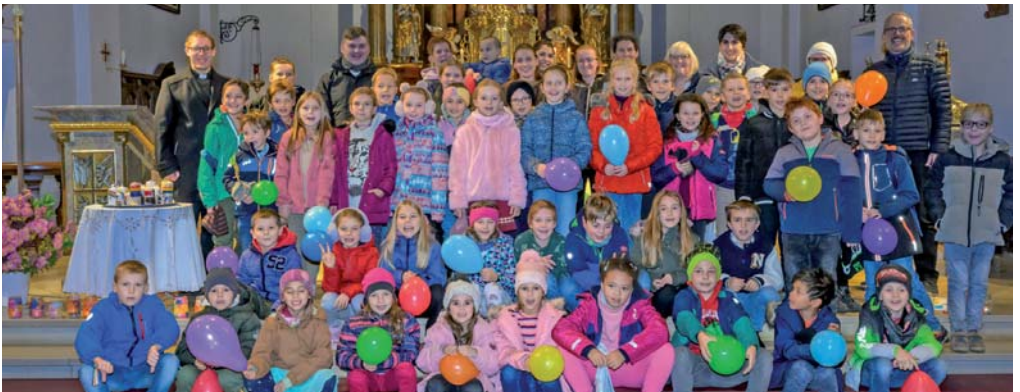
Ökumenischer Kinderbibeltag Buxheim am 11. November „Noah und der Regenbogen“

– schauen Sie einfach rein! Dieses Jahr wird wieder die Krippe ausgestellt, die Frauen aus unserer Gemeinde vor vielen Jahren selbst hergestellt haben.