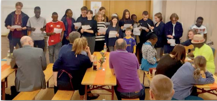
Gemeinsames Lied der Jugendlichen beim Abschiedessen am 14. April

Danke – ASANTE – an unsere teilnehmenden Jugendlichen, an den AK Tansania, an die Gastfamilien, an die „Küchenperlen“, die Übersetzenden, an das Orga-Team und natürlich an die Partnergemeinde Kilakala!