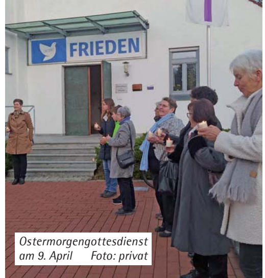
Ostermorgengottesdienst am 9. April

Zum nächsten Ökumenischen Friedensgebet laden wir ein am Freitag, den 12. Mai um 19.00 Uhr in die katholische Pfarrkirche Gaimersheim.