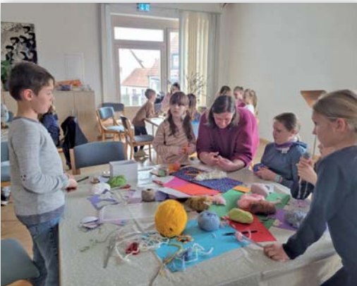
Osterbasteln für Kinder am 24. März