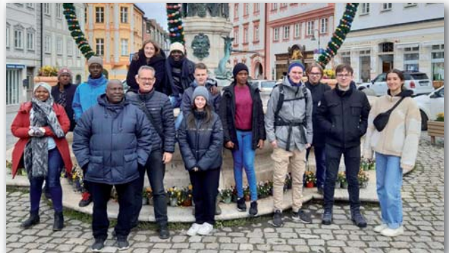
Österlicher Spaziergang in Eichstätt