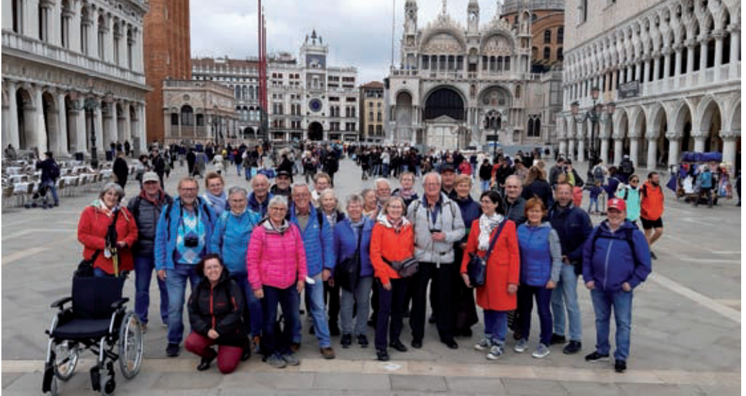
26 Teilnehmende aus den Kirchengemeinden Ingolstadt-St. Johannes und Gaimersheim waren im Rahmen einer Gemeindefahrt in der Woche nach Ostern in Venedig.