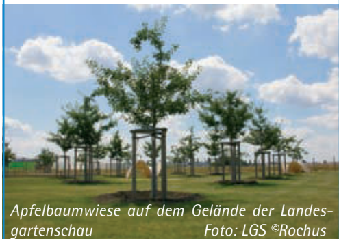
Apfelbaumwiese auf dem Gelände der Landesgartenschau

Aktuelle Infos finden sich auf https://www.lgs-kirche.de und auf https://veranstaltungen.ingolstadt2020.de/region/glaubeundbegegnung/