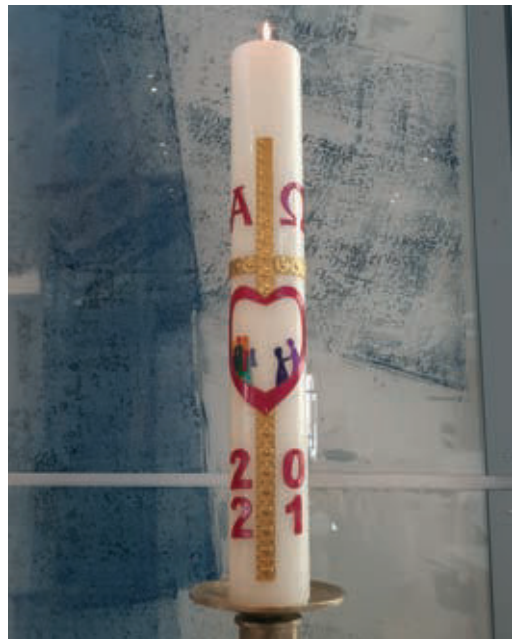
Unsere neue Osterkerze