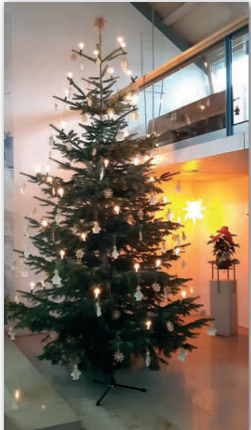
Weihnachten 2020 in der Christuskirche.