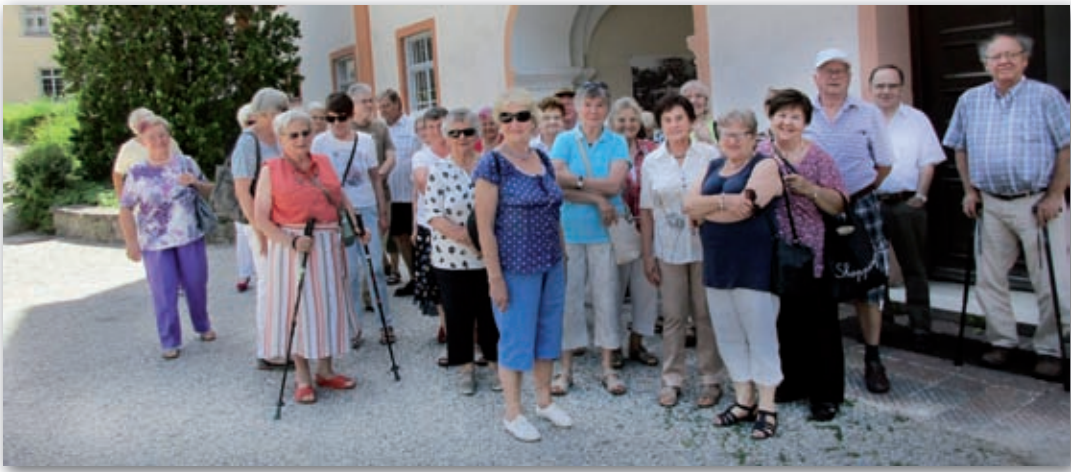
Ausflug von Seniorennachmittag und Frauenkreis nach Scheyern am 25. Juni.