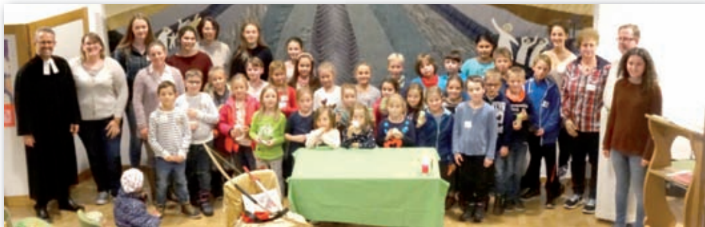
Ökumenischer Kinderbibeltag Buxheim im November.

► Arbeitskreis Tansania: Kontakt: Pfr. Eckert (Tel. 0176/31013599)