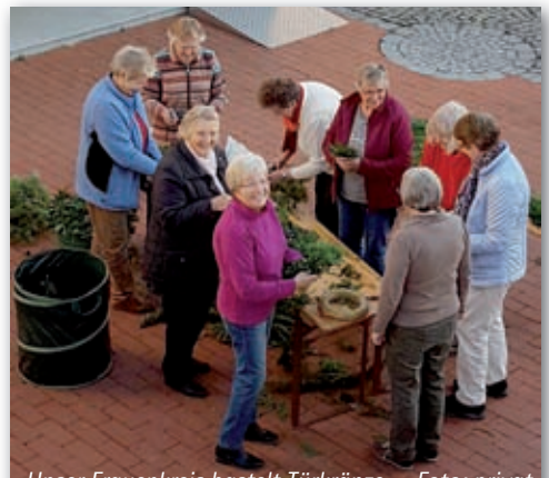
Unser Frauenkreis bastelt Türkränze

◆ Im Rahmen Herbstsammlung der Diakonie wurden uns 385 Euro anvertraut, die wir ans Diakonische Werk weitergeleitet haben. Herzlichen Dank!