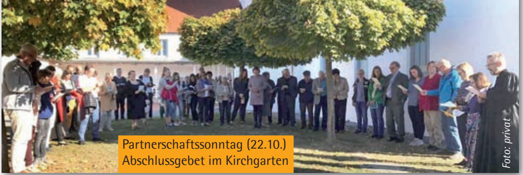
Partnerschaftssonntag (22.10.) Abschlussgebet im Kirchgarten