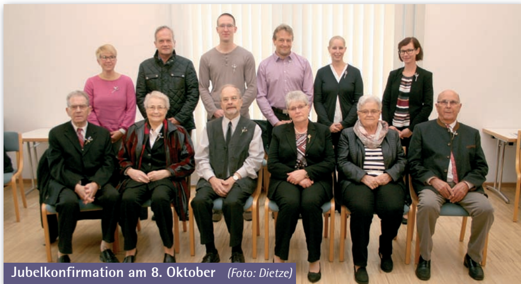
Jubelkonfirmation am 8. Oktober