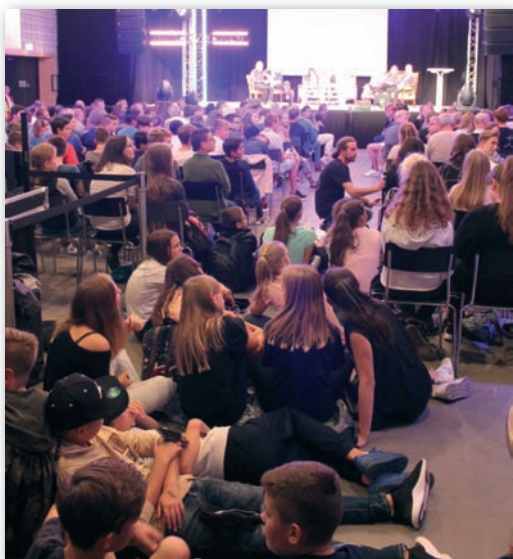
Event der Evangelischen Jugend in Ingolstadt am 23. September

Oder lesen Sie einfach die „gute alte“ Druck-Ausgabe. Diese ist im Pfarramt erhältlich.