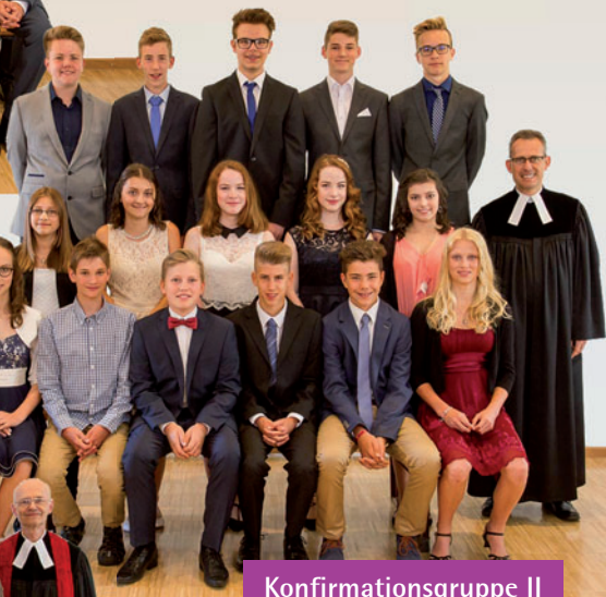
Konfirmationsgruppe II 3. Juli 2016