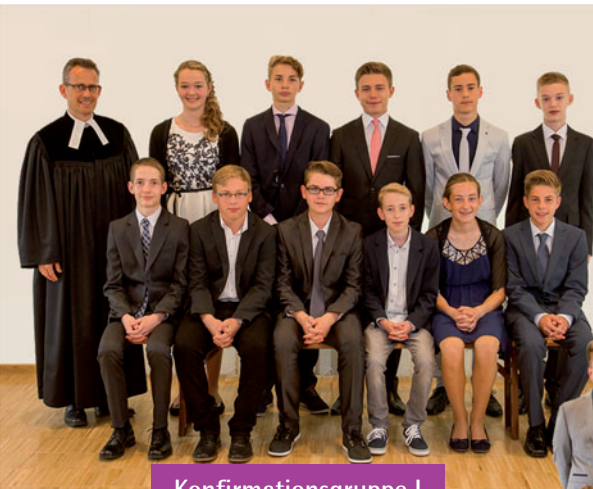
Konfirmationsgruppe I 26. Juni 2016