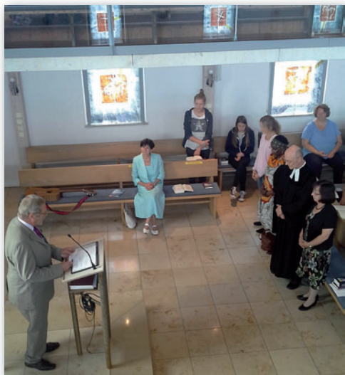
Aussendungsgottesdienst der Tansania-Delegation (siehe auch Artikel links „Über den Tellerrand geschaut“)

■ Eine Delegation unserer Gemeinde wird vom 21. August bis 6. September in Tansania sein und dort vor allem die Kirchengemeinde Kilakala und den Großraum Morogoro besuchen.