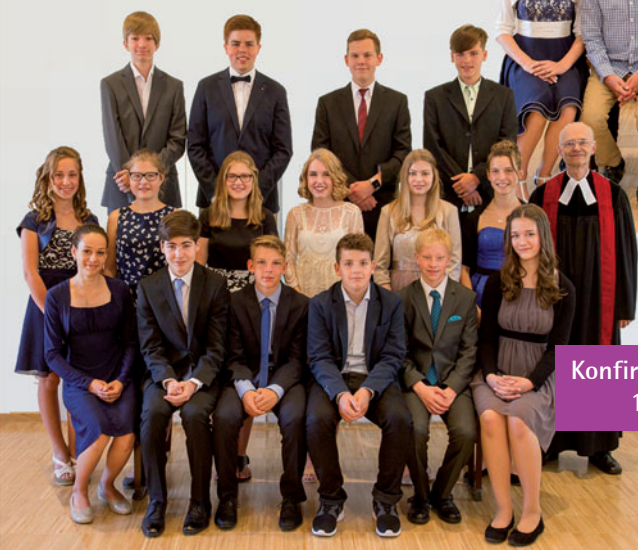
Konfirmationsgruppe III 10. Juli 2016