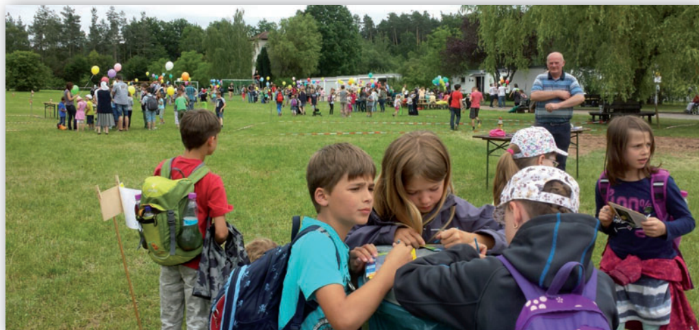
Ausflug unserer Kindergruppe „Smarties“ nach Puschendorf.