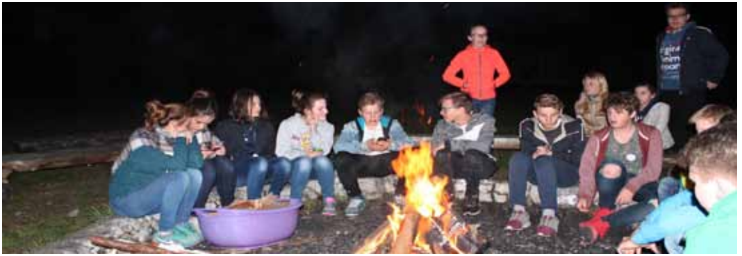
Konfirmandenwochenende in Riedenburg vom 29. April bis 1. Mai.