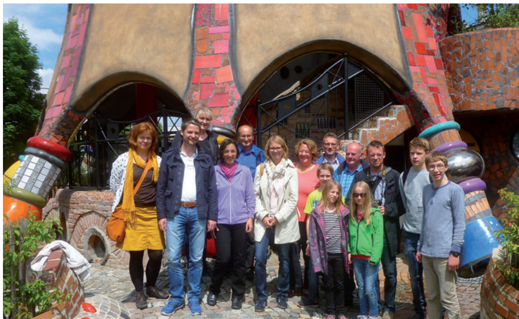
Ausflug des Hauskreises nach Abensberg