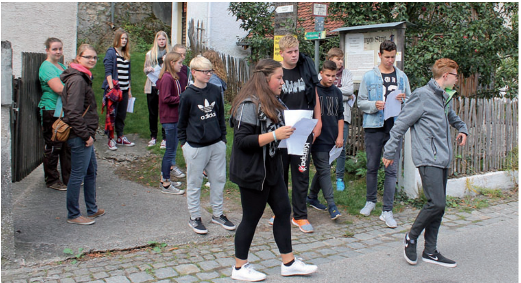
Freizeit für die Konfirmierten 2015 in Riedenburg