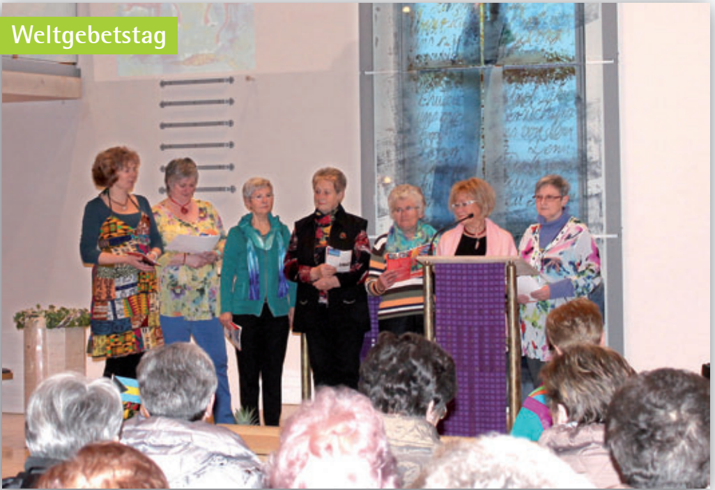
Weltgebetstagsgottesdienst in unserer Friedenskirche am 6. März.