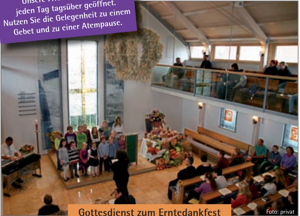
Gottesdienst zum Erntedankfest

Unsere Friedenskirche ist jeden Tag tagsüber geöffnet. Nutzen Sie die Gelegenheit zu einem Gebet und zu einer Atempause.